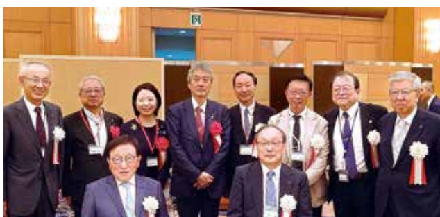
中国四国医師会連合総会懇親会