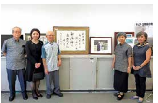
9月27日 対馬丸記念館を視察 沈没した対馬丸が発見された時、上皇陛下がお詠みになられた御製とともに