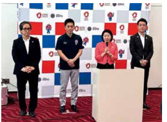
9月17日 大阪・関西万博について吉村洋文大阪府知事と横山英幸大阪市長との意見交換および夢洲会場視察

経済振興、離島のインフラ整備などはよりいっそう力強く取り組まなければなりません。北方においても、わが国固有の領土である国後島、択捉島、色丹島、歯舞群島を不法占拠するロシアが二〇二二年二月からウクライナへの侵略を続けているなど、予断を許さない状況です。難しい局面でバトンを引き継ぎますが、国際社会との連携のもとでわが国の主権と平和を守るため力を尽くす決意です。消費者及び食品安全についても、健康食品や補聴器等の医療機器、美容関係の広告など医療との関係でさまざまな問題があり、取り組んできた分野です。