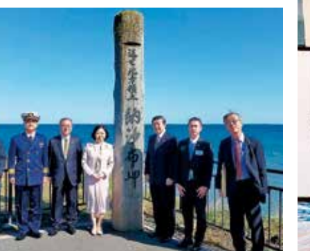
10月12日 北海道根室の納沙布岬から北方領土を視察