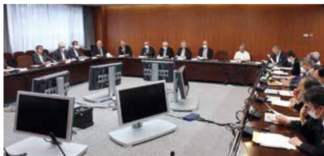
常任執行委員会会場

「資料1は、八月末からの政治日程と来年度予算案に関する流れである。衆議院の解散・総選挙は、当面は行われないとの見方も出てきているが、年末の診療報酬改定に向けて日医連としてしっかりと陳情活動の対応をしていきたいと考えている。とくに来年はトリプル改定の年であり、都道府県医師連盟の先生方との連携も今まで以上に重要と考えている。」 資料2は、以前の執行委員会でもお示した『国政選挙等の候補者選考基準・参議院比例代表選挙候補者選出要領』であり、すでに一月十七日の執行委員会でご承認いただいているが、次期参議院比例代表選挙の候補者については、本選考基準により公募を行うことを決定いただいた。 また、令和七年七月に予定されている第二十七回参議院比例代表選挙についても、本年一月十七日に開催した執行委員会において、次の事項をご承認いただいた。①次期参議院比例代表選挙に日医連の組織内候補者を擁立すること、②組織を代表する推薦候補者を政権与党である自由民主党から擁立すること、