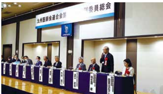
九州医師会連合会総会