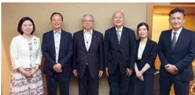
大分県医師会役員との意見交換