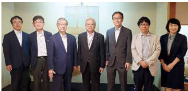
鹿児島県医師会役員との意見交換