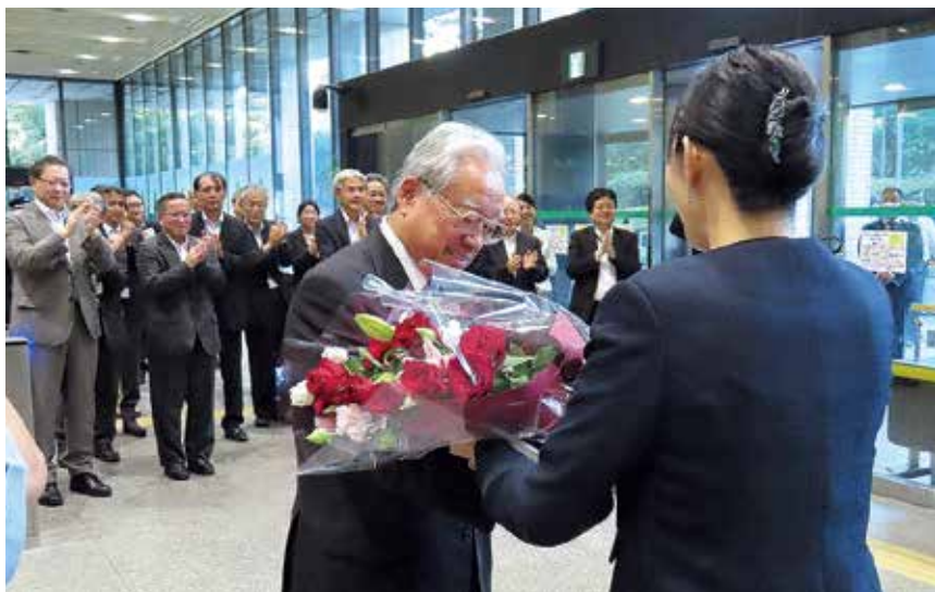
厚生労働副大臣退任式

誰がこのような日本を望んでいるのでしょうか。日本全国どこにいても一定水準の良質な医療が受けられるという、日本が誇る国民皆保険の堅持のためにも、医療・介護・福祉の充実を実現して参りたいと思っております。