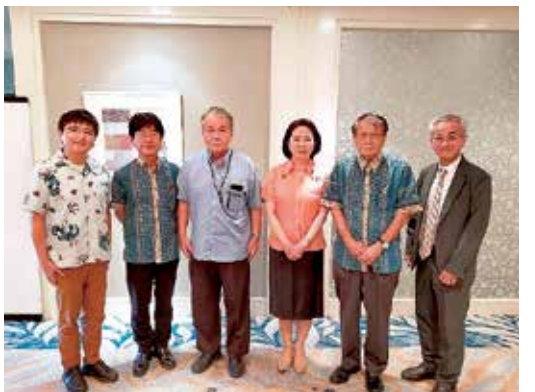
9月28日 沖縄県医師連盟役員の方と意見交換