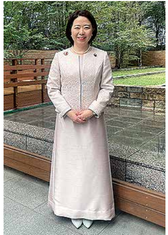
9月23日 秋季皇霊祭および秋季神楽祭の儀に参列

ベビー用品やライフジャケット、サッカーゴールなど、こどもの事故予防との関係でも重要な分野です。アイヌ施策も、これまで大臣政務官として所管して参りましたが、大臣というより大きな責任のほどで取り組んでいかなければなりません。これら多岐にわたる所管に全身全霊で取り組んで参る決意ですが、未だ若輩、未熟ゆえに、これからもさまざまな場面で先生方のお力添えをいただかなければならないと存じます。よりいっそうの温かいご指導とご支援を心よりお願い申し上げます。初任閣のご挨拶とさせていただきます。