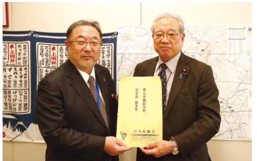
羽生田俊参議院議員へ税制改正要望書提出