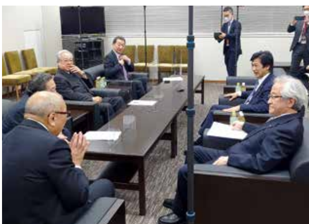
田村憲久衆議院議員と取材の風景