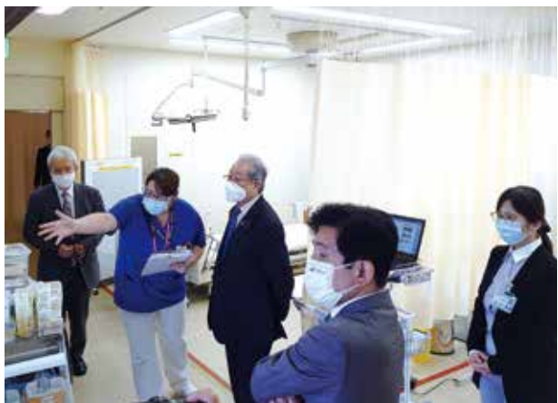
国立病院機構小倉医療センターを視察