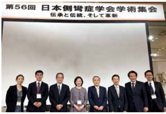
11月4日 日本側彎症学会学術集会にて。このほか、東日本小児科学会などさまざまな学会で講演させていただけることは、本当に光栄です