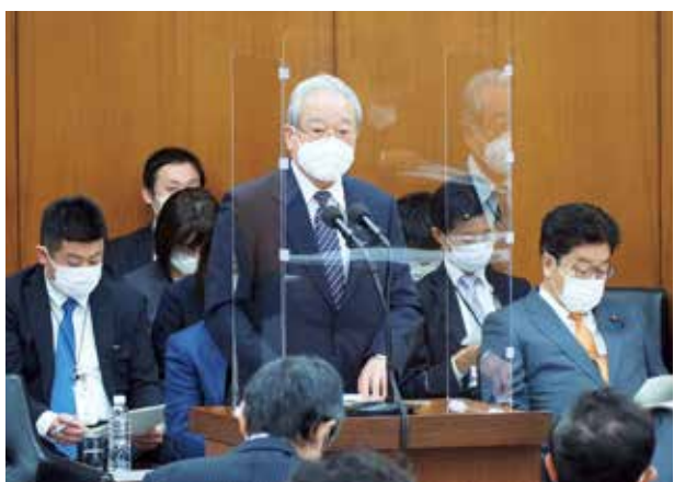
衆議院厚生労働委員会にて答弁

が、かねてより医療は財政論に押され、効率化・適正化の名のもとに削減や抑制を押しつけられてきました。コロナ対応に至っては財政審をはじめ政府・マスコミにより医療機関では診てもらえなかったという誤った認識を国民に植え付けられました。今般のコロナ対応は感染症法上二類相当としたため、保健所を通ることになっており、入口となる保健所の機能がパンクしたのであって、法律上も医療提供体制も想定をしていなかった未知の感染症でありました。それを財政審が、医療機関が診なかつたと発信するなどもってのほかであり、マスコミも無責任な誤った報道を繰り返すことを恥ずべきであり、反省すべきです。とはいえ、医療提供体制が整っていないがために、医療者として患者に手を差し伸べら