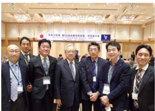
川崎市医師会の先生方と全国学校保健・学校医大会にて