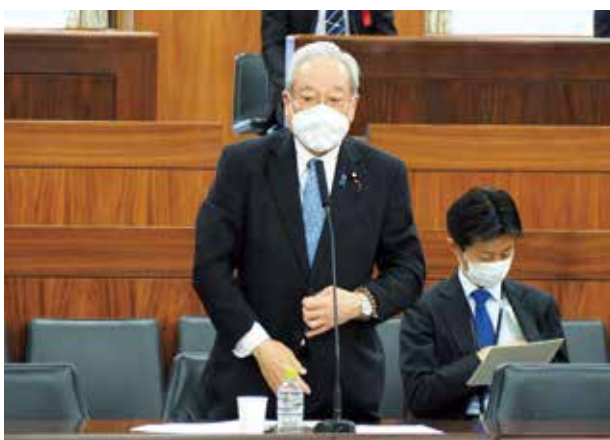
参議院厚生労働委員会にて答弁