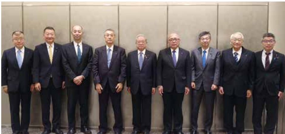
日医役員と当選1回生議員の意見交換会

れなかつたことは痛恨の極みであり、今一度この国の社会保障の充実に医療界が一丸となって努力することに私も尽力して参ります。