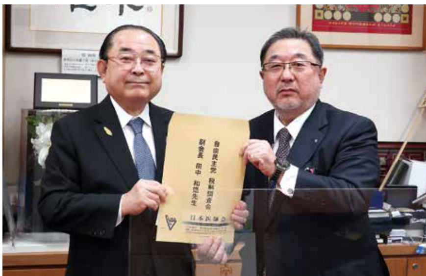
田中和徳衆議院議員へ税制改正要望書提出