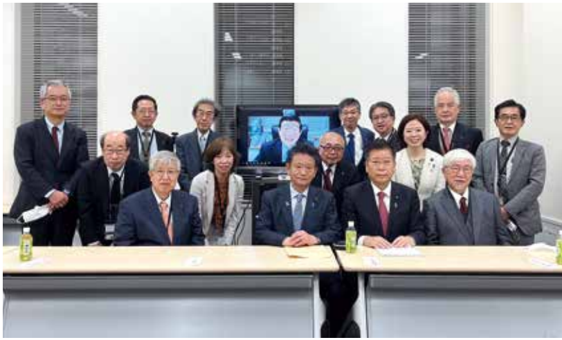
11月17日 有床診療所の活性化を目指す議員連盟総会にて、全国有床診療所連絡協議会の先生方と