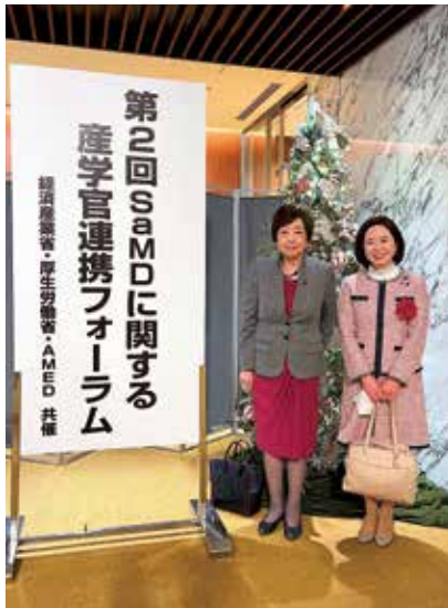
12月1日 経済産業省、厚生労働省、AMED共催によるプログラム医療機器 (SaMD) に関する産学官連携フォーラムにて、太田房江経済産業副大臣と