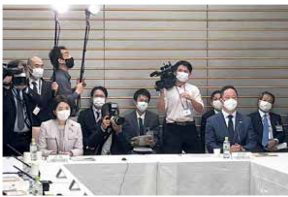
10月25日 首相官邸で岸田文雄内閣総理大臣も出席されて開催された「国と地方の協議の場」で司会進行を務めました