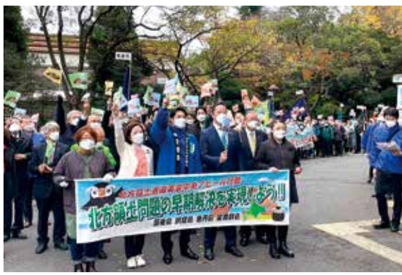
12月1日 鈴木直道北海道知事、和田義明内閣府副大臣とともに内閣府大臣政務官として北方領土返還要求中央アピール行動に参加