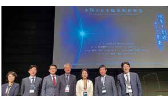
10月15日 日本臨床眼科学会で講演