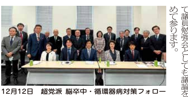
12月12日 超党派 脳卒中・循環器病対策フォローアップ議員連盟第6回総会